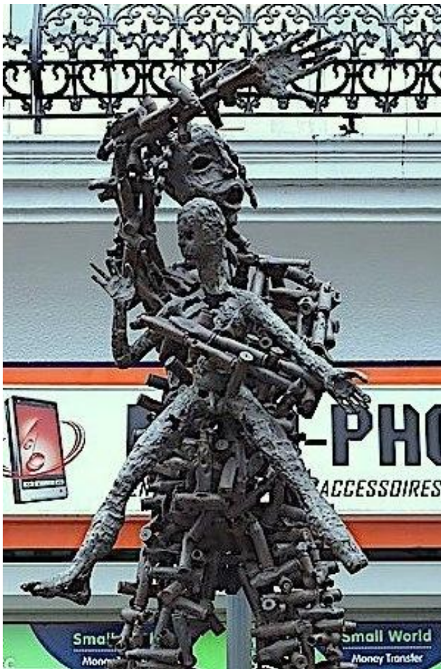
Freddy Tsimba "Au-delà de l'espoir" 2007