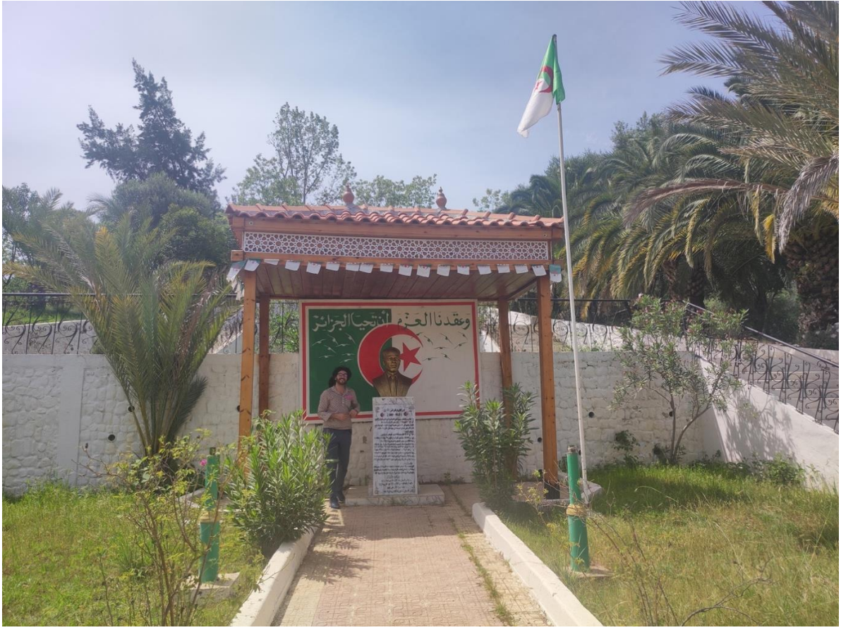
Mémorial Frantz Fanon, Aïn Kerma, Algérie